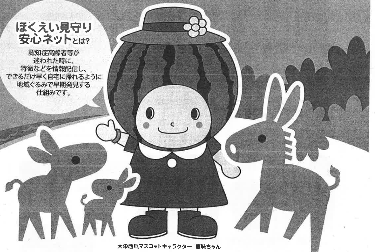
大栄西瓜マスコットキャラクター 夏味ちゃん

認知症高齢者等が迷われた時に、特徴などを情報配信し、できるだけ早く自宅に帰れるように地域ぐるみで早期発見する仕組みです。