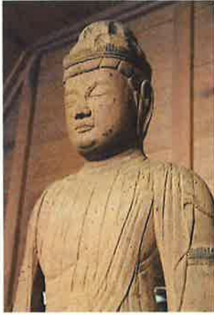
東高尾観音寺木造十一面観音菩薩立像