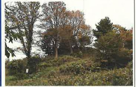
土下236号墳(北条大将塚古墳)