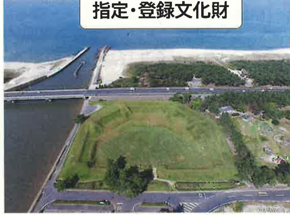
鳥取藩由良台場跡