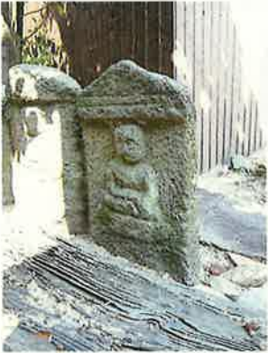
江北地内板碑型石仏