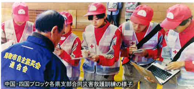
中国・四国ブロック各県支部合同災害救護訓練の様子

終わりのない災害への対応力を強化するため、鳥取県東部を震源とした地震での広域災害を想定し、中・四国9県の救護班が集結して、鳥取市を中心に災害救護訓練を実施しました。