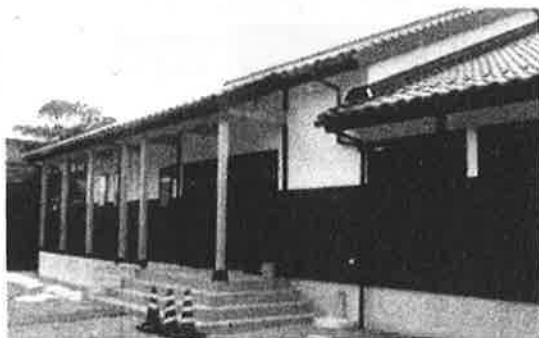
完成した由良宿1区自治公民館