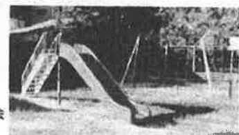
▶西高尾自治会の遊具