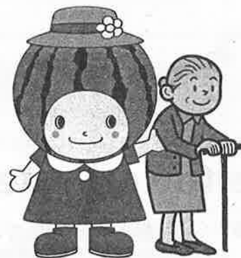
大栄西瓜マスコットキャラクター 夏味ちゃん

サービス事業者に申し込み(契約)後、①契約書の写し②初期費用の確認できる領収書の写し③交付対象者の身分証明書④印鑑をお持ちの上、窓口へお越しください。書類審査後、口座振込にて助成金をお支払いします。