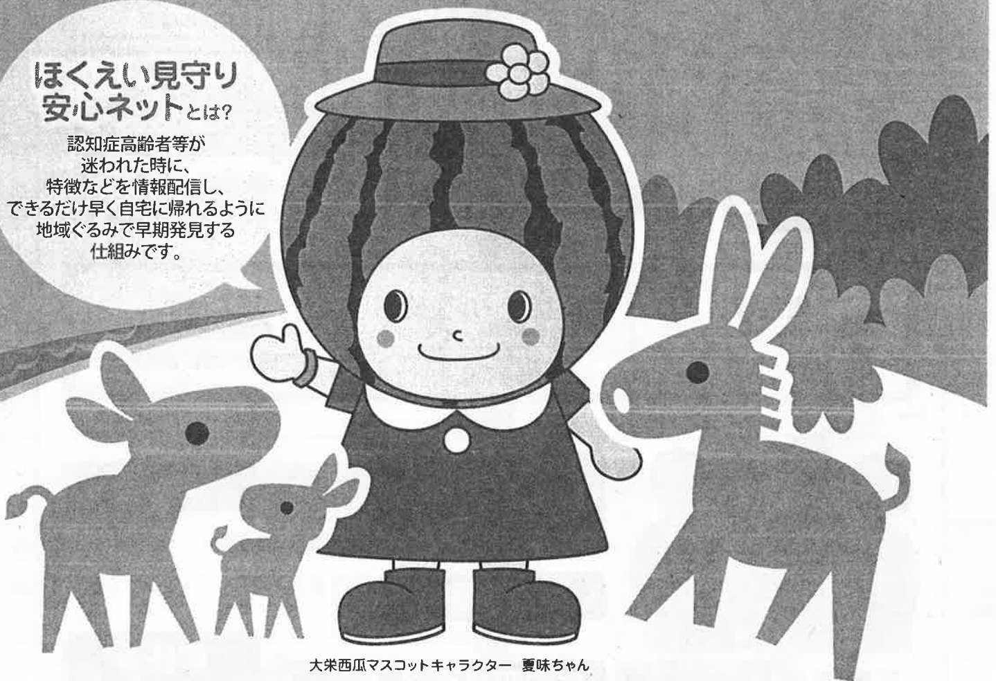
大栄西瓜マスコットキャラクター 夏味ちゃん

認知症高齢者等が 迷われた時に、 特徴などを情報配信し、 できるだけ早く自宅に帰れるように 地域ぐるみで早期発見する 仕組みです。