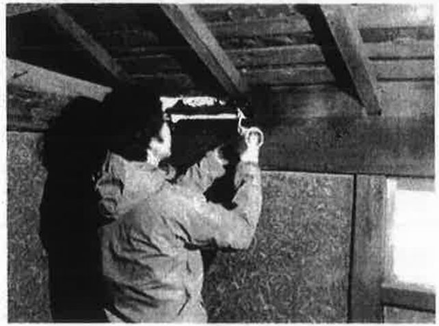
●隙間を発泡ウレタンで埋めています↓