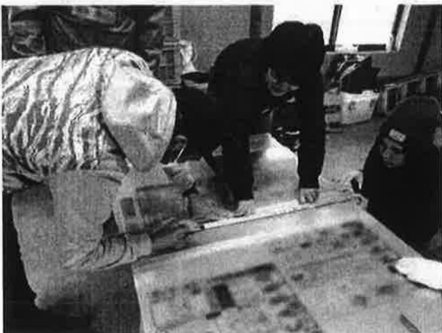
●建具にポリカーボネートを貼るところ↓