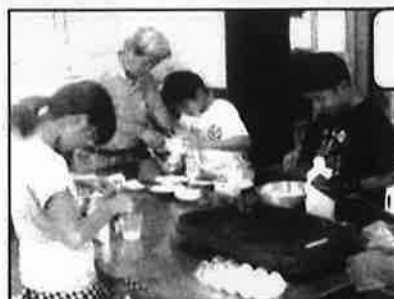
ホットケーキ作り