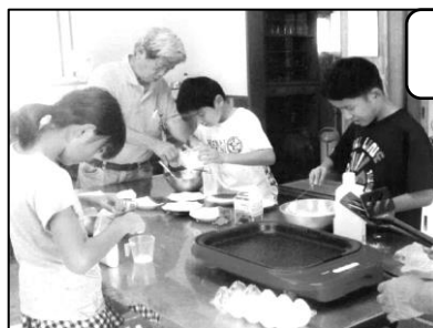
ホットケーキ作り