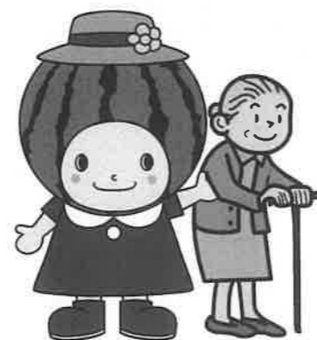
大栄西瓜マスコットキャラクター 夏味ちゃん

サービス事業者に申し込み(契約)後、①契約書の写し②初期費用の確認できる領収書の写し③交付対象者の身分証明書④印鑑をお持ちの上、窓口へお越しください。書類審査後、口座振込にて助成金をお支払いします。