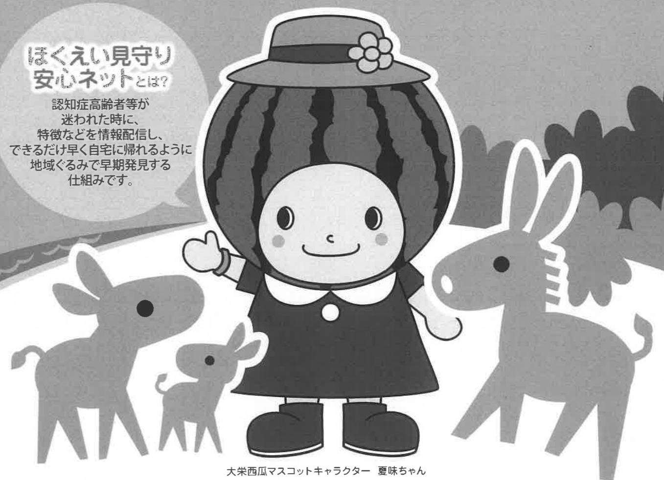
大栄西瓜マスコットキャラクター 夏味ちゃん

認知症高齢者等が迷われた時に、特徴などを情報配信し、できるだけ早く自宅に帰れるように地域ぐるみで早期発見する仕組みです。