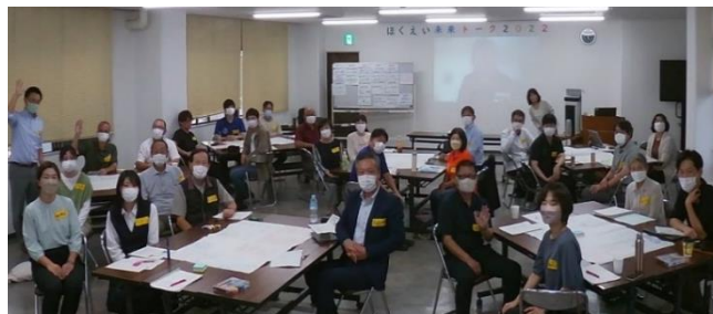
第14回全国風サミ ほかえい未来トーク（ワークショップ） 11日