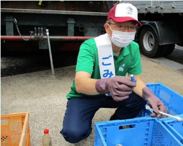
(環境パトロールの様子)