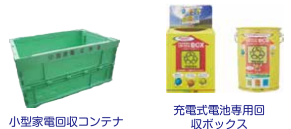
小型家電回収コンテナ

絶縁処理をしたら小型家電で出してください。リチウムイオン電池等の充電式電池は電器店等に設置してある専用回収ボックスでも出すことができます。