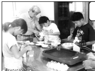
ホットケーキ作り