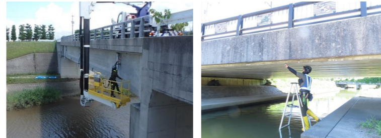
■損傷度IIIの橋梁 番ノ木橋（補修工事中）