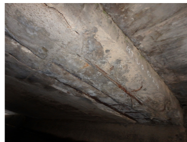
コンクリートの剥離