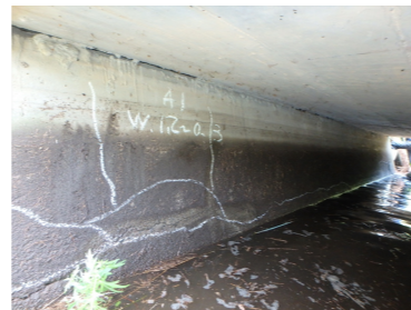
コンクリートのひびわれ