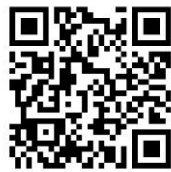
新たな推進計画 の詳細はコチラ