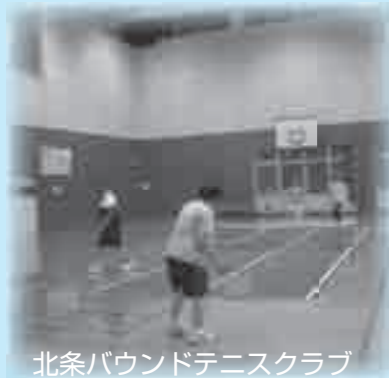
北条パウンドテニスクラブ