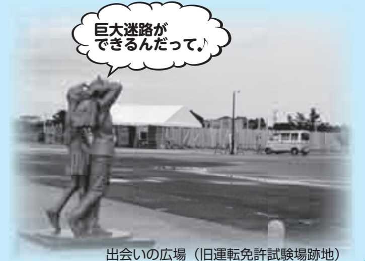
出会の広場（旧運転免許試験場跡地）