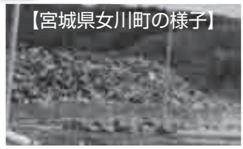
【宮城県女川町の様子】