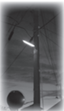
照度検査はしていない。