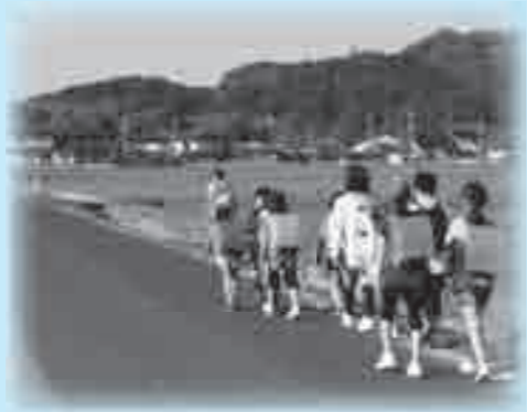
通学路安全対策費 (52万5千円)