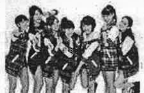
公式応援団 アップアップガールズ(仮)