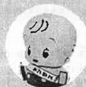
国勢調査 イメージキャラクター センサスくん