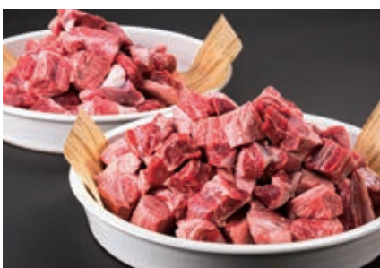
1月 煮込み用すね肉ブロック 4kg