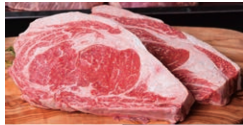
《ロース》 鳥取和牛 「mere Rouge」 ロースステーキ