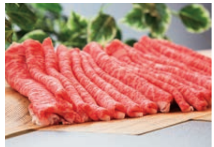
12月 すき焼きセット 2kg (ロース1kg、モモ1kg)