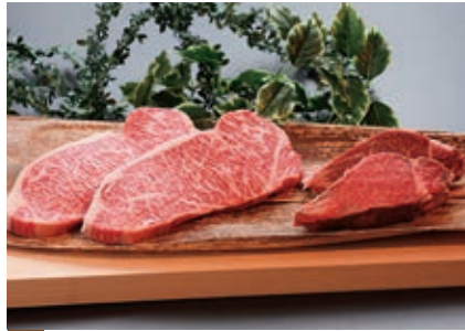
5月 ロースとヒレのステーキセット 2kg (ロース1kg、ヒレ1kg)