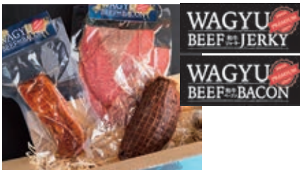
10月 和牛の加工品セット (和牛ベーコン160g、和牛ジャーキー100g、 和牛ロースビーフ300g)