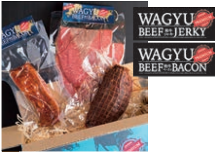
4月 和牛の加工品セット (和牛ベーコン160g、和牛ジャーキー100g、 和牛ローストビーフ300g)

1年間、毎月、季節におすすめの食べ方で鳥取自慢のお肉セットをお送りします。ステーキ、焼肉、すき焼き、切り落としは鳥取和牛A5、A4ランクのお肉を中心に使用。和牛ベーコンは東京のミツ星レストランで使用されている高級加工品です。鳥取和牛の新ブランド「mere Rouge」の超希少肉も加わり、魅力たっぷりなお肉のセットをどうぞご賞味ください。 【事業所名】あかまる牛肉店