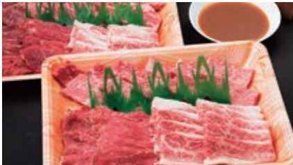
4月 焼き肉セット 1kg (ロース、カルビ、モモなど) 自家製たれ付