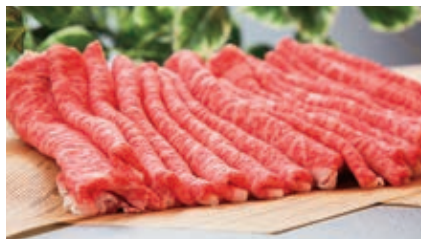
12月 すき焼きセット 1kg (ロース、肩、モモなど)