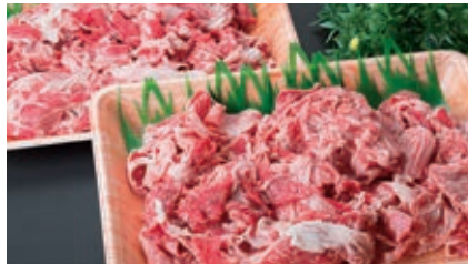
6月 切り落としセット 1kg (バラ、ネック、ブリスケ、スネなどの切り落とし)