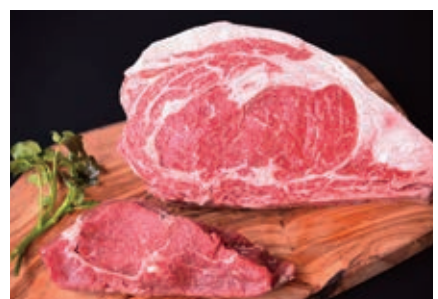
3月 鳥取和牛[mere Rouge] ロースステーキ 1kg、 ヒレステーキ 1kg