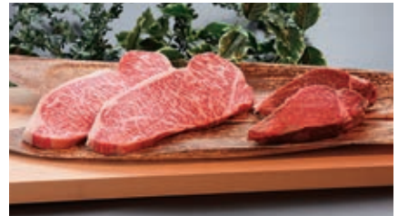
8月 ステーキセット 1kg (ロース500g、ヒレ500g)