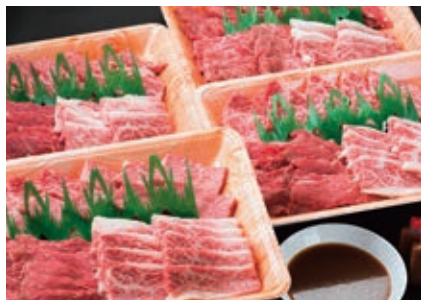
11月 焼き肉セット 2kg (ロース、カルビ、モモなど) 自家製たれ付