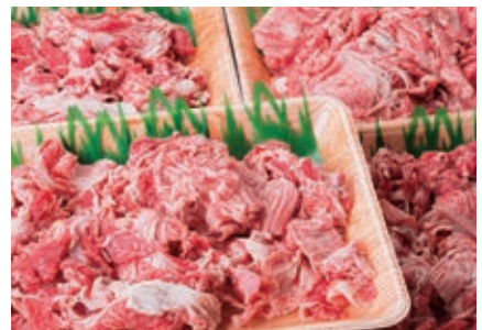
9月 切り落としセット 2kg