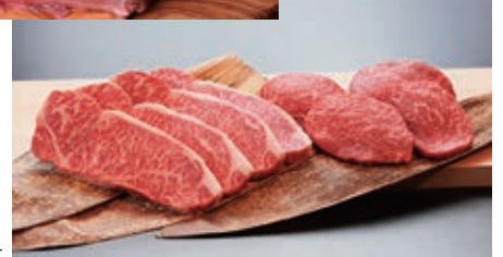
《ロース》 鳥取和牛 A4~A5ランク ロースステーキ 《希少部位》 鳥取和牛 A4~A5ランク 希少部位ステーキ