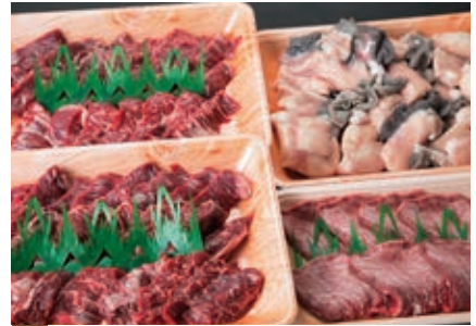
6月 ハラミ、タン、ホルモンの焼肉セット 2kg (ハラミ1kg、上タン200g、 ミックスホルモン800g)