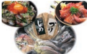
※写真の生たまご、イクラ、ガリのり、ネギは商品に含まれておりません。

日本海産の干物、秘伝のたれで漬こんだづけ丼の素、昆布の旨みが絶妙に効いた昆布じめ丼の素がセットになった商品です。ご飯との相性が抜群です。