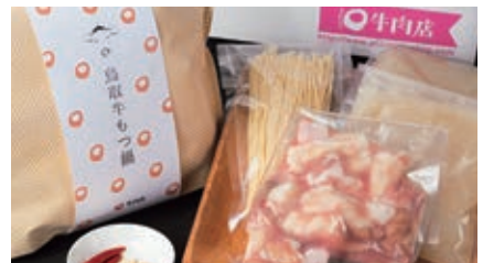
2月 もつ鍋セット 2~3人前 (ミックスホルモン300g、スープ、ラーメン付き)