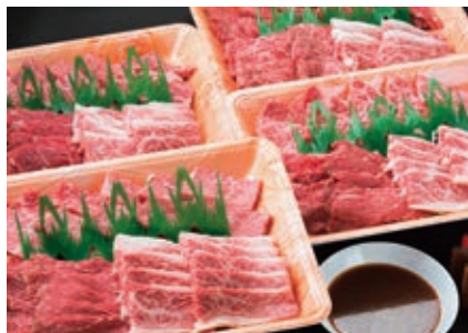
8月 焼き肉セット 2kg (ロース、カルビ、モモなど) 自家製たれ付