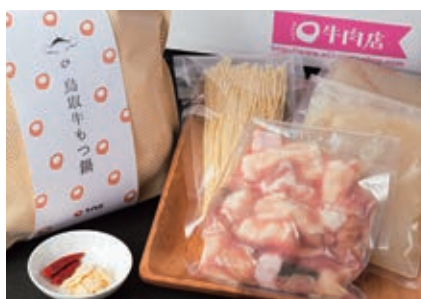
2月 もつ鍋セット 2~3人前 (ミックスホルモン300g、スープ、ラーメン付き) ×2セット