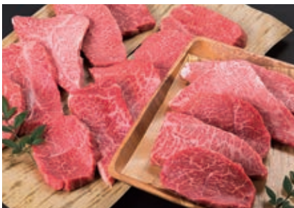
7月 希少部位のミニステーキセット 2kg (ミスジ、ランプ、イチボなど)