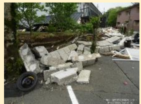
倒壊したブロック塀（平成28年熊本大震災）