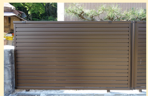
安全な軽量フェンスへの改修例