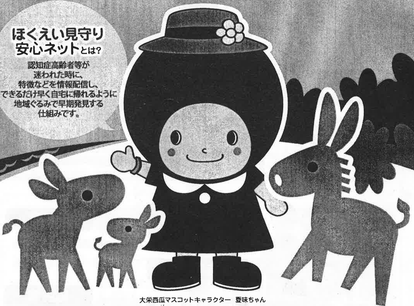
大栄西瓜マスコットキャラクター 夏味ちゃん

認知症高齢者等が 迷われた時に、 特徴などを情報配信し、 できるだけ早く自宅に帰れるように 地域ぐるみで早期発見する 仕組みです。