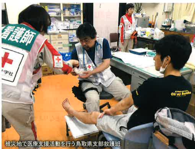
被災地で医療支援活動を行う鳥取県支部救護班