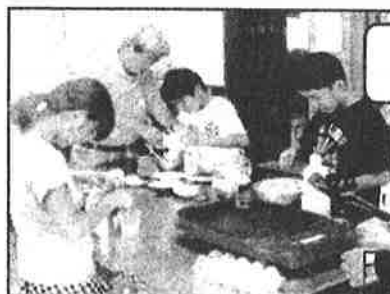
ホットケーキ作り