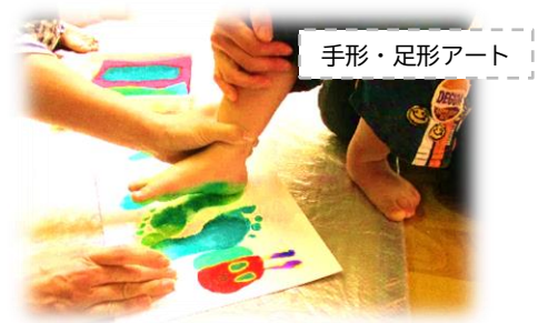
手形・足形アート