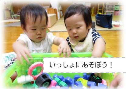
いっしょにあそぼう！