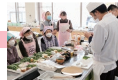
令和3年度 第6回学習会の様子 調理師連合会の先生に家でも作れるごちそうを習いました。