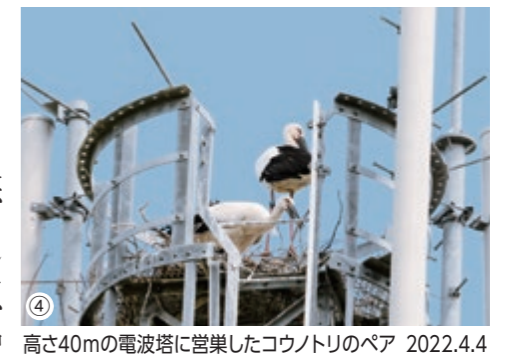
高さ40mの電波塔に営巣したウノトリのペア 2022.4.4

ウノトリは、ロシア、中国、朝鮮半島、日本等に生息し、翼を広げると2mにもなる大型鳥類です。国内のウノトリは、1971年に野生絶滅しましたが、2005年に兵庫県立ウノトリの郷公園が人工繁殖した5羽のウノトリを放鳥し、野生復帰の取り組みが始められました。まだまだ個体数の少ないウノトリですが、近年は北条町でも目撃情報がありました。そして、ついに今年3月にはウノトリのペアが町内で営巣していることが確認されました。4月に産卵、5月にはふ化し、現在3羽のひなが元気に育っています。