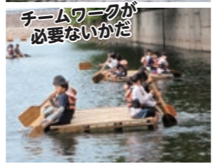
チームワークが必要ないかだ