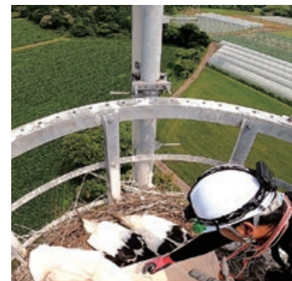
高所作業員によるひなの捕獲