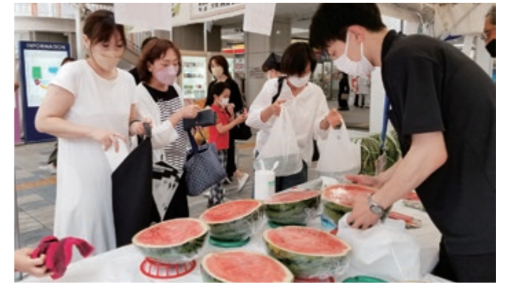
コロナ禍で3年ぶりの対面販売をする職員

青山剛昌ふるさと館 ホームページ更新中! 問: 青山剛昌ふるさと館 ☎37-5389 HP: https://www.gamf.jp