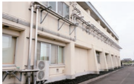
ゾーン空調機の配管