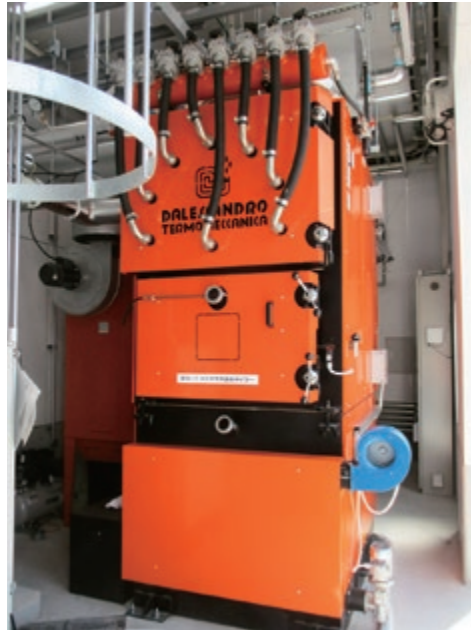
木質バイオマスボイラー

この事業は、環境省の二酸化炭素排出抑制対策事業費等補助金（地域の防災・減災と低炭素化を同時実現する自立・分散型エネルギー設備等導入推進事業）を活用して行いました。