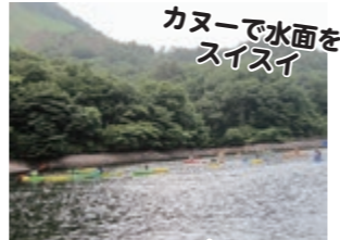
カヌーで水面をスイスイ