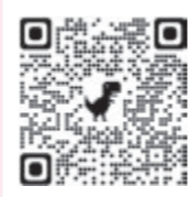
脱炭素ロードマップ

12月22日、北栄町環境審議会で脱炭素ロードマップについて説明し、委員から脱炭素の取り組みが必要な理由を町民にわかりやすく説明し、危機感の共有や町民全体での取り組みの啓発が大切といったご意見をいただきました。