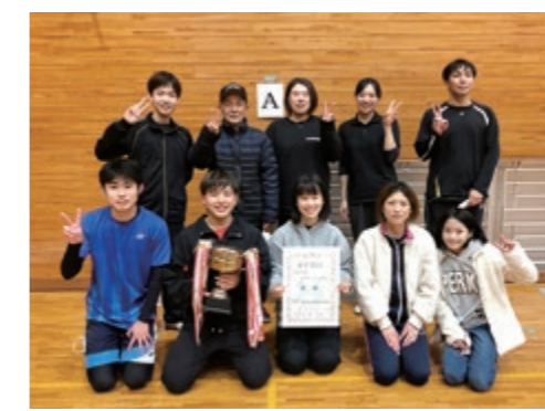
見事初優勝を果たした田井自治会