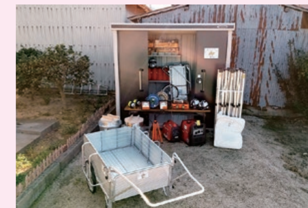
整備した防災資機材

※この助成事業は、宝くじの社会貢献広報事業として、宝くじの受託事業収入を財源に実施されています。