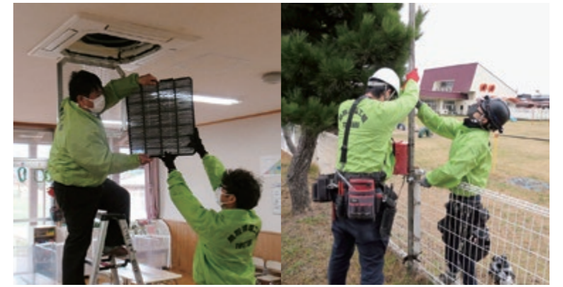
照明器具やエアコンを点検・掃除していただきました

12月17日、北条こども園と由良こども園で、鳥取県電気工事業工業組合青年部会倉吉支部による電気設備の点検・清掃が行われました。この活動は、電気知識や技術を生かして地域に貢献する活動の一つとして、県内の児童福祉施設を対象に毎年行われており、今回は、不要になっていた外灯の撤去と、高所の照明器具や換気扇の清掃を行いました。