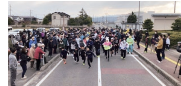
元旦マラソン&ウォーキング大会

今年の大会は386人の参加があり、フレッシュな気持ちで新年のスタートを切りました。