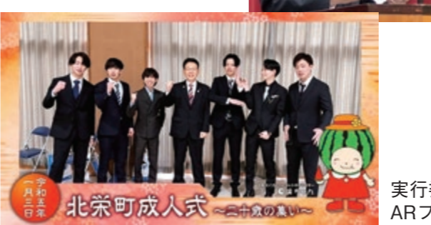
実行委員会が企画した成人式限定 ARフォトフレームを利用して写真撮影