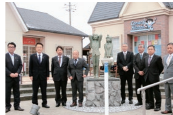
「ぜひ皆さんでご利用ください」と話すライオンズクラブの皆さん

鳥取県中部地区ライオンズクラブから「コナンの家 米花商店街」にカメラスタンドが2台寄贈され、12月21日に贈呈式を行いました。カメラスタンドは、「コナンの家 米花商店街」にあるオブジェ「おすわりコナン」と「はじまりの瞬間」の前にそれぞれ設置されており、観光客の皆さんにオブジェの記念撮影をより楽しんでもいただけるようになっていきます。鳥取県中部地区ライオンズクラブは、倉吉ライオンズクラブ、倉吉打吹ライオンズクラブ、倉吉北ライオンズクラブで構成され、地域貢献などの活動を行われています。