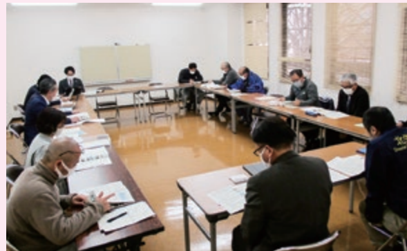
農業分野の意見交換会