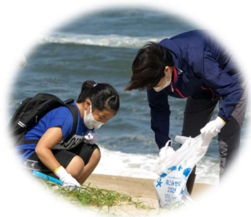
地球教室「海岸清掃をしよう！」の様子