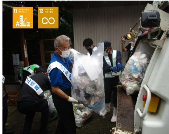
(環境パトロールの様子)