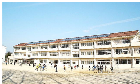
北条小学校の太陽光発電