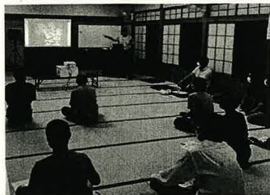
人権を学ぶ会 曲自治会