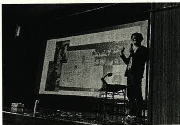
ほくえい未来ラボ 大栄分館 未来構想提案