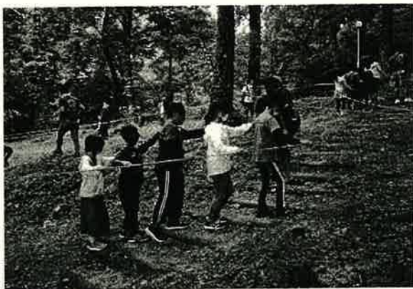
中部少年少女のつどい 団体活動のひとつコマ