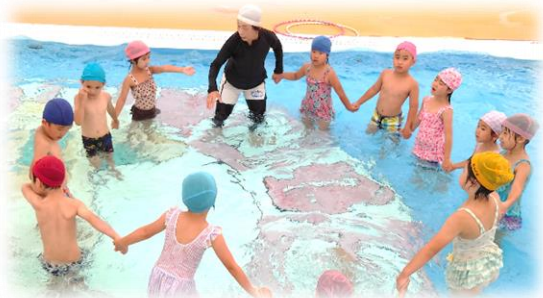
～友達と手をつないで顔つけに挑戦する5歳児～

夏の間のプール遊びで、心も体もひとまわり大きくなった子どもたち。プール開きの直後は、水に入るのが怖くて友達の遊ぶ様子をじっと見ていた子どももいましたが、そっと足をつけてみることから始まり、少しずつ、少しずつ水と仲良しになっていきました。大きい組の園児は、「～できるようにになりたい！」と願いを持って、繰り返し頑張る姿がたくさん見られました。何より感動したのは、友達の頑張る姿を見て「頑張れ！」と応援してくれたり、「すごいね！できたね！」と、自分のことのように喜んでくれた園児の姿でした。2学期は、運動会や発表会などの行事もあります。今後も一人一人の良さや可能性が輝いていくよう、職員全員での教育・保育に努めます。朝夕が涼しくなり、少しずつ秋らしさも感じますが、日中はまだ蒸し暑い日が続きます。夏の疲れが出て体調を崩しやすくなる時期です。健康管理には十分気をつけて元気に過ごしましょう！