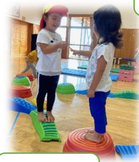
でこぼこ道で出会ったら、「じゃんけんぽん!」