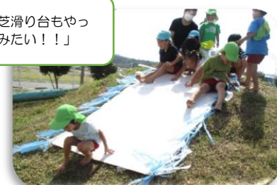
「芝滑り台もやってみたい!!」