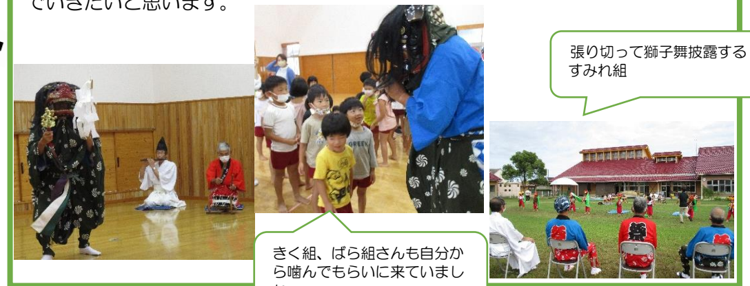
張り切って獅子舞披露するすみれ組

大誠こども園こどもししまいは、これからも地域の伝統を受け継いで取り組んでいきたいと思っています。