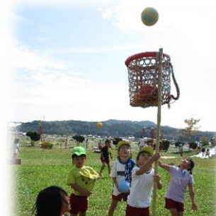
かごを持つのはすみれ組。「いれるぞ!」