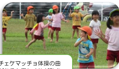
チェクマッショ体操の曲がなると思わず体が動き出す♪