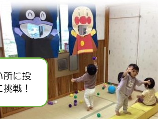
運動会後は高い所に投げてみることに挑戦!