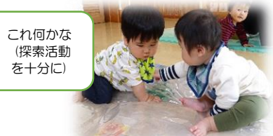
これ何かな(探索活動を十分に)