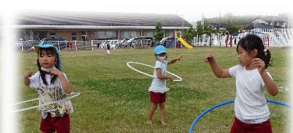
フープまわしにチャレンジ(用具を使って)