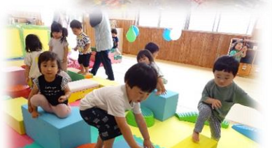
でこぼこみち(はう、渡る)