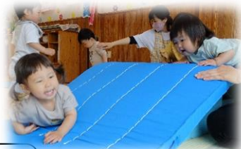
マット山のぼり(よじ登る、滑る)

今年度の園の研究主題を「もっとやってみよう！友達と一緒に いっぱい遊ぼうよ」としてあります。昨年度に続き、園児の発達や興味・関心に応じて自らが思わず体が動かしたくなったり、「もっとやってみよう」と繰り返し楽しんだりできるような遊びの環境や援助の工夫をして取り組んでいきます。