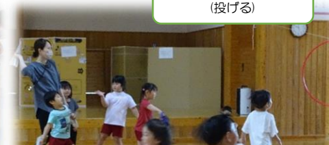
紙飛行機飛ばすよ(投げる)