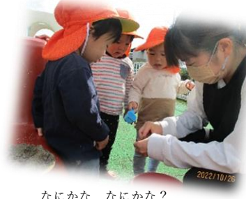
なにかな、なにかな?