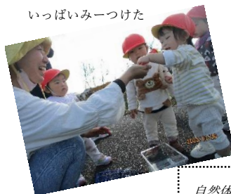
いっぱいみつけた

[0歳児]保育者との応答的な関わりを通して、思いや欲求を喃語や身振り、指差しで伝える子