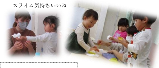
スライム気持ちいいね