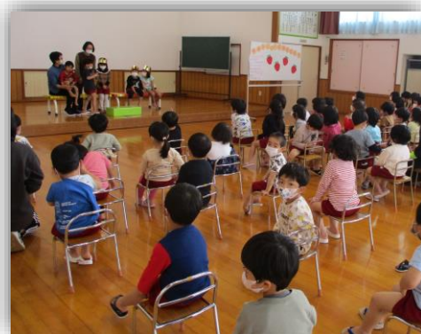
♡4月のお誕生日の友達をお祝い♡