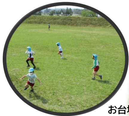
お台場は第2の園庭！