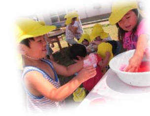
友達と一緒にいいね