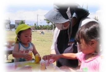
☆8月は幼稚部を紹介します。

今月の教育・保育目標 ○水に親しみをもちながら、水遊びやプール遊びを楽しむ。 ○生き物を観察したり、飼育したりして興味や関心をもつ。 ○水遊びやプール遊びのルールや約束を知り、守る。