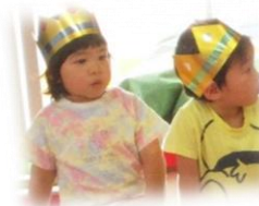
誕生会ではお話も聞きます

[2歳児]保育者や友達と一緒にいろいろな遊びをする中で、簡単な言葉でやりとりを楽しむ子