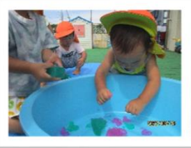
発見したことや面白かったことを 身振りや言葉で伝えようとする姿 が素敵です