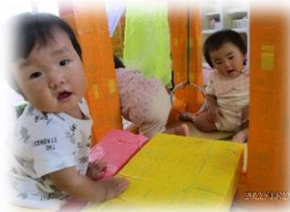
いろいろなものへの興味☆

[0歳児] 保育者との応答的な関わりを通して、思いや欲求を喃語や身振り、指差して伝える子