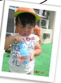
楽しいことが いっぱい