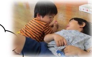
友達と一緒に なんか楽しい☆

先生や友達と一緒にすることが少しずつ楽しく なってくる時期です。安心できる人へ自ら 言葉やしぐさで思いを伝える姿が素敵です。