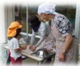
上手に包丁で切れるかな？