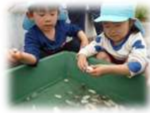
真っ白になるまで頑張るぞ～