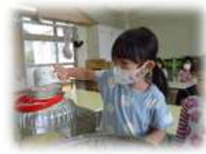
美味しいらっきょうになってね！