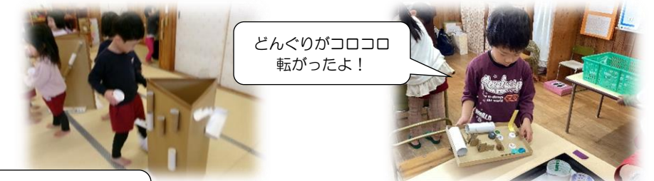
キリン公園（4・5歳児）