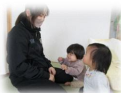
目線を合わせて伝わる喜びを

【2歳児】保育者や友達と一緒にいろいろな遊びをする中で、簡単な言葉でやりとりを楽しむ子