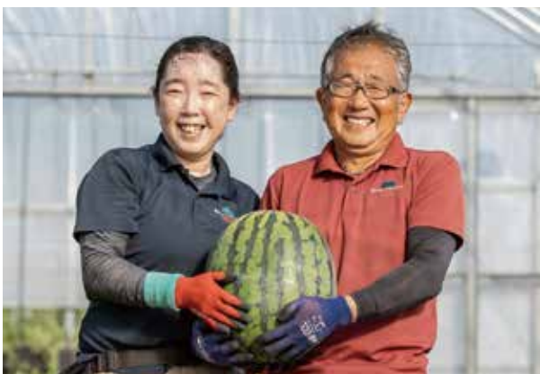
株式会社Agriすぎかわ・杉川夫妻

「販路の一つとして町から声をかけていただいたのがきっかけ」と話すのは、羅王ザ・スウィートを返礼品として提供している株式会社