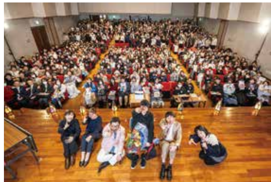
青山先生と約400人のファンで記念撮影 ©青山剛昌／小学館

名探偵コナンイラストコンテストの表彰式や、コナングッズが当たるジャンケン大会、コミックスに名前が載る権利の抽選会、先生への質問タイムなど青山先生との直接のやりとりには会場は興奮に包まれました。特に、質問タイムでは過去最多質問者数の68人からファンならではの名探偵コナン作品に関する質問があり貴重な話も飛び出すなど、参加者は夢のような時間を過ごしました。