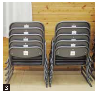
1・2・3_助成事業により導入されたエアコン、プリンター、座椅子などの備品

1月3日、北条農村環境改善センターで「二十歳の集い」を開催し、平成17年度に生まれた140人の新成人が、輝かしい門出を迎えました。式典では、町長が「北栄町も合併から20周年を迎え、皆さんと共に歩んできました。若い皆さんの柔軟な発想と力を、これからの町の発展に貸してほしい」と式辞を述べ、前田議長からも温かい祝辞が贈られました。