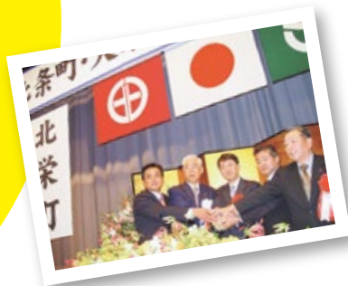
▲舊北條町和舊大榮町的合併

迎接町制施行 20 周年的北榮町 前人一路走來的足跡，從過去到現在 並連接到未來