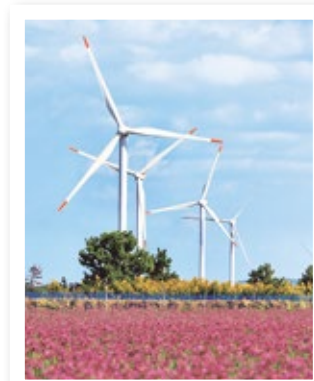
▲北條沙丘風力發電所運轉