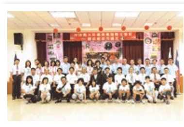
▲與台灣台中縣大肚鄉（現在的台中市大肚區）簽訂友好交流協議書