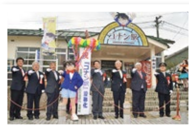
▲JR 由良站暱稱為「柯南站」