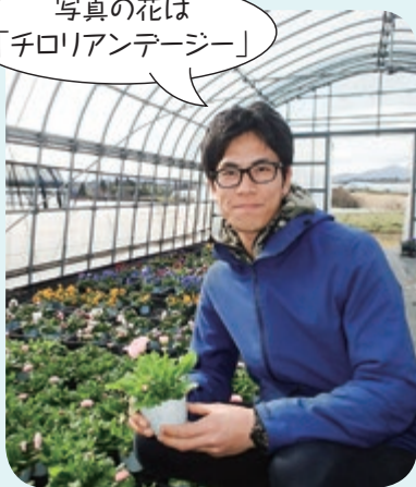
写真の花は「チロリアンデージー」