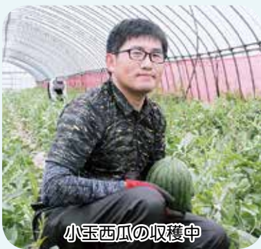
小玉西瓜の収穫中