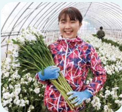
ストックの収穫中