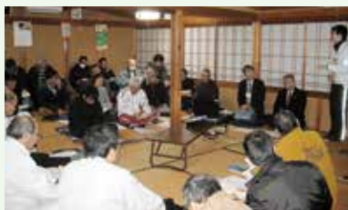
上種地区での話し合いの様子 (H30年度)

農業従事者の高齢化や後継者不足、耕作放棄地の増加などの理由で、将来の農業の展望が描けない中、地域の状況を把握し、集落や地域で話し合いを進めるため、アンケートを実施しています。