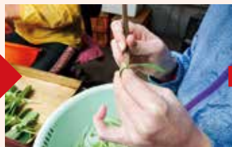
串で台木に穴を開ける