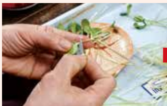
かみそりでスイカの穂木の断面を斜めに切る