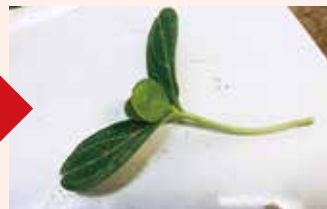
台木に穂木を刺す