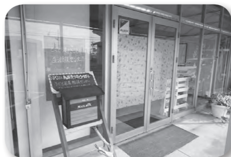
県が設置したとっとりひきこもり生活支援センター(由良宿)