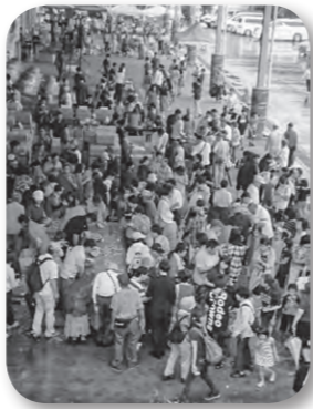
にぎわったスイカ祭り

足したが、農地等の利用の最適化について、農業委員、農地利用最適化推進委員それぞれの立場でどのように活動されるのか。また、新会長の意気込みは。農業と発電事業を同時に行うソーラーシェアリングの許可や設置後の監視等について変化はあるか。