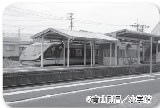
由良駅に待機中のスーパーはくと

② 「天地(あめつち)」をチャーターし、町民号「名探偵コナン号」を復活してはどうか。JRの営業に協力し、由良駅に快速列車の全便停車を働きかけるべき。 ③ 駅の窓口業務を町観光協会が受諾できるように、JRとの橋渡しをしては。