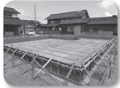
町内者の新築にも補助が必要

①ネウボラで受けた様々な相談が合計115件あり、医療機関や各課の支援や情報共有等、連携がうまく取れていると感じている。 ②民間から農地の開発や出店の話があれば、農振変更を検討する。公園については出会いの広場の一部芝生化に取り組み。 ③町民の町内新築補助については、いい提案を頂いたのでスピード感をもって、至急に実現に向け検討する。