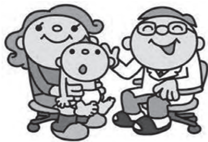
すこやかな子育てのために