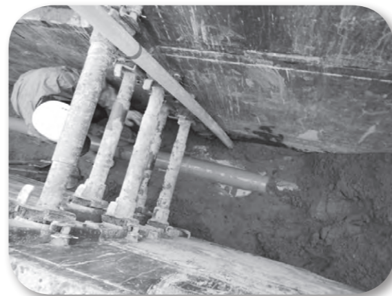
下水道の工事現場