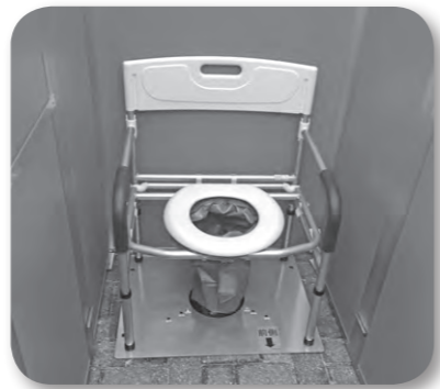
マンホールトイレ

町長 一般的に避難者50人にトイレ1基が目安とされており、小・中学校の避難所収容人数と学校トイレの数からすれば、不足している状況ではない。現時点ではマンホールトイレの配備は必要ない。防災計画や避難所の見直し時には検討すべき事項である。