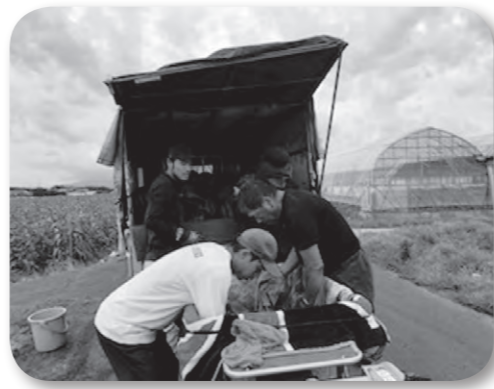
従業員と一緒にすいかの収穫