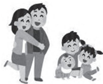
多子世帯を支援して