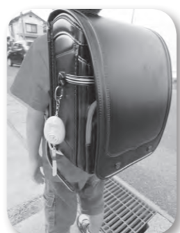
すぐ手の届くところに防犯ブザーを