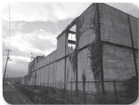
老朽化した北側ブロック塀

年1回、外周フェンスから3メートルの範囲を除草している。土下自治会から野生動物の捕獲依頼があり、イタチ1匹を捕獲した。全国展開の菓子流通卸売りメーカーが、物流拠点として候補地と比較しながら進出検討をしており、県立地戦略課と連携し進出に結び付けたい。