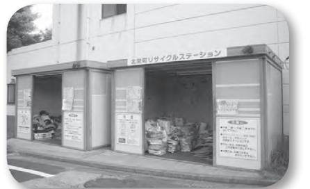
北栄町リサイクルステーション