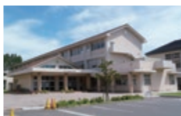
北条小学校 北栄町国坂680番地 TEL 0858-36-2063