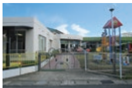
社会福祉法人みどり会 北条みどりこども園 北栄町江北484-3 TEL 0858-36-4213