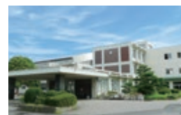
大栄中学校 北栄町由良宿340番地 TEL 0858-37-2024

【部活動】 野球・ソフトテニス・剣道・卓球・バドミントン・バスケットボール・吹奏楽・サッカー・ソフトボール・美術・(駅伝)