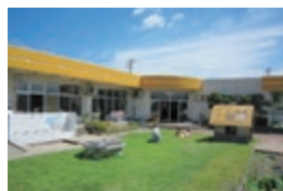
大谷こども園 北栄町大谷2112-175 TEL 0858-37-2149