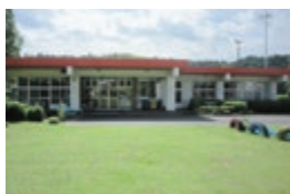
北栄町社会福祉協議会 栄保育所 北栄町下種373-4 TEL 0858-37-2626