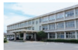
大栄小学校 北栄町由良宿213番地 TEL 0858-37-2041