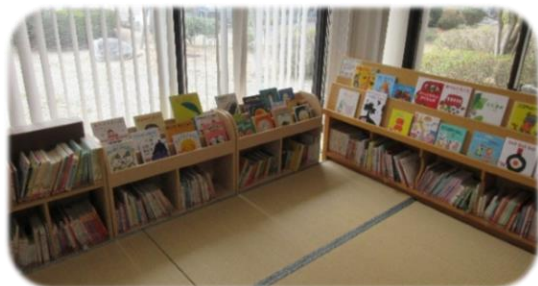
図書館本館 「キッズコーナー」 ⇒