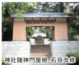
神社随神門屋根・石垣改修

他ではなかなか経験できない免揚業に携わることが出来ます。また、地域に密着して100年以上の歴史を持つ当社は、地元の方々からの信頼も厚く、『岩垣組さんに任せれば安心』と言っていただけるのも大きな誇りです。お客様から直接感謝の言葉をいただけることは、働く私たちの大きなやりがいにつながっています。