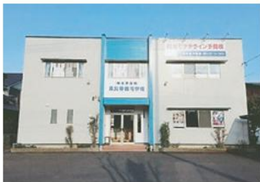
中央予備校・倉吉本部教室

鳥取県中・西部の小・中学生が約15名来てくれています。学校も学年も違う生徒たちが和気あいあいと生活しています。勉強だけでなく様々な体験活動を通して皆さんの刺激を受けてほしいと心から願います。