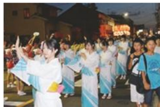
倉吉打吹まつり〜みつぼし踊り