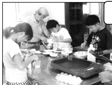
ホットケーキ作り