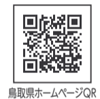
鳥取県ホームページQR